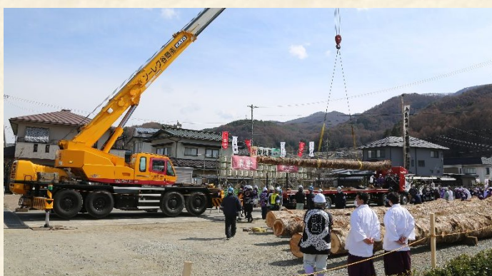
御柱屋敷に到着。クレーンを使って所定の位置へ