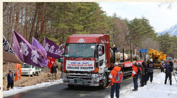
クレーンを使ってトレーラーに載せ綱置場を出発