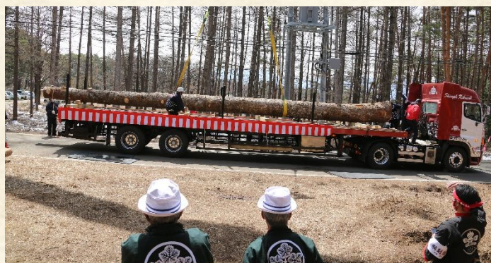
白バイ2台の先導で運搬 宮川橋では御柱清めの水掛け