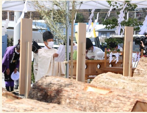
山出しの終了を奉告