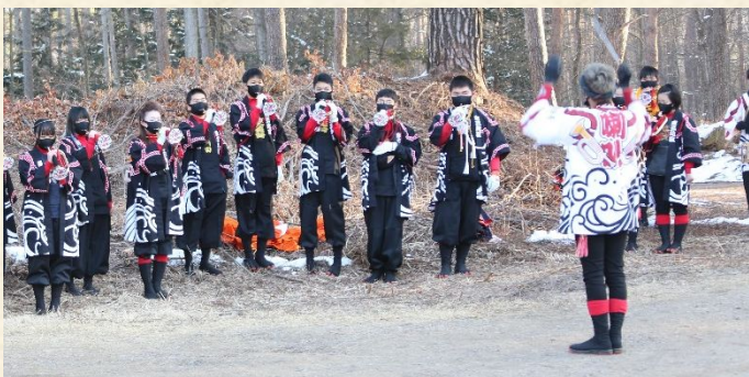
木遣りとラップが響かなければ、準備も先に進まない