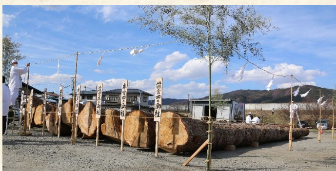
御柱屋敷に並んだ8本の御柱