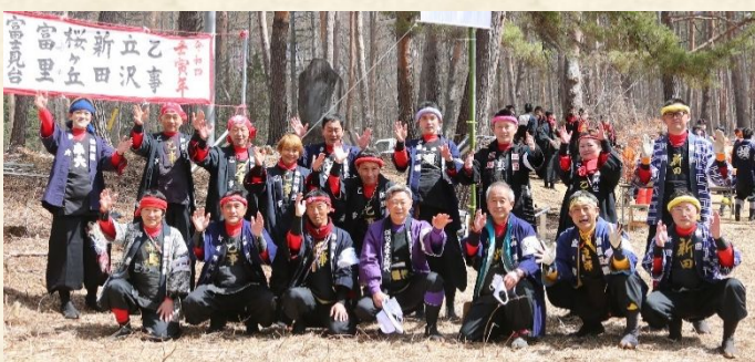
御柱の積み込み開始までの時間を使って、地区や係ごとに記念撮影