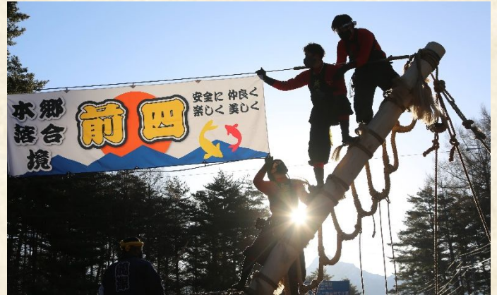
陽春の光を浴びて山出し準備