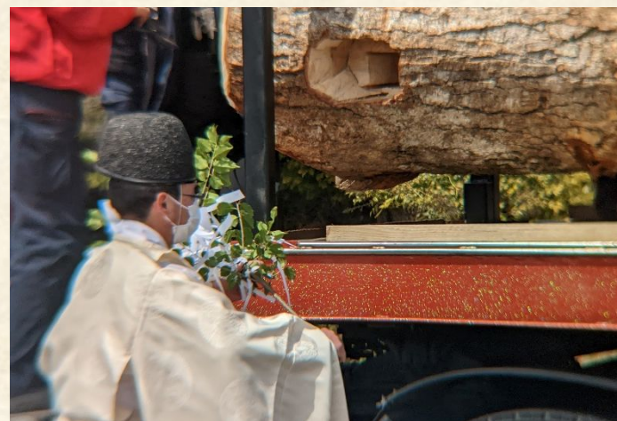
途中、清め払いの神事