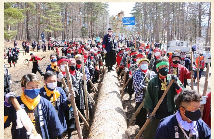
御柱の舵取り、小艇子衆

山出し当日に於きましても、新型コロナウイルス感染対策に関するガイドラインに基づき、検温や健康チェック表の提出および感染対策を施した上で活動しました。集合写真については、撮影時のみ一時的にマスクを外しています。